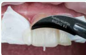
8. Poista muovin ylimäärät terällä