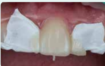
7. Valokoveta silikoni-indeksin läpi ja poista se sitten paikoiltaan