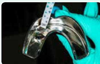
2. Täytä jäljennöslusikka EXACLEAR-materiaalilla ja ota vahatusta kipsimallista jäljennös