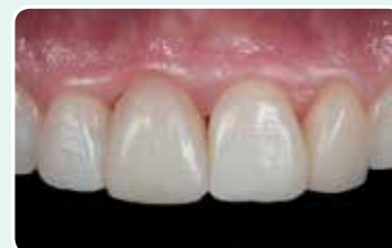
9. Lopputulos parin kiillotusvaiheen jälkeen