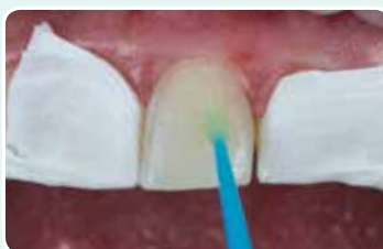
5. Eristä viereinen hammas, etsaa kiille ja levitä sidosaine