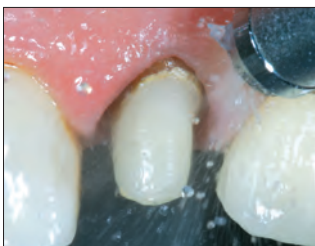
4. Poista lanka. Puhdista 35 %:lla fosforihapolla. Huuhtele voimakkaalla ilma-vesisuihkulla. Helpottaa hallintaa esteettisellä alueella ilman ikenen värjäymiä.