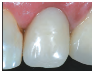
5. Valmis restauraatio 2 viikon kuluttua toimenpiteen jälkeen.