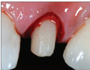
1. Subgingivaalinen preparointi ja vuotava ientasku.