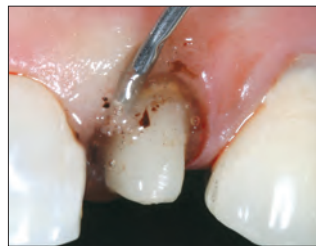
2. Hiero hemostaasiaine tiiviisti vuotavia kudoksia vasten Dento-Infusor-kärjellä. Kirkas geeli mahdollistaa hyvän näkyvyyden ja huuhtoutuu nopeasti pois.