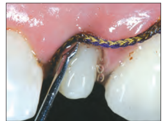
3. Aseta kastettu Ultrapak™-lanka ientaskuun. Jätä se paikalleen 5 minuutiksi.