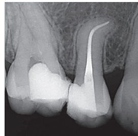
Toimenpiteen jälkeen Preparointi: 35/.04