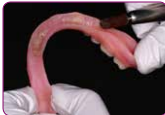
Kevennä pohjattava alue ja karhenna pinta.