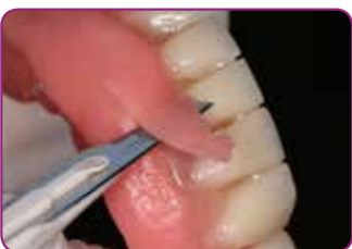
Poista ylimäärä veitsellä tai saksilla. Trimmaa GC RELINE II -trimmauskärjellä.