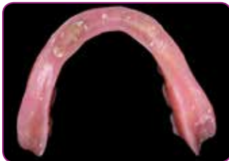
Pohjattava proteesi, kun 4 implanttia on asetettu paikalleen.