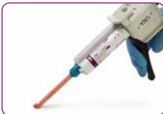
Annostele kätevästi patruunasta