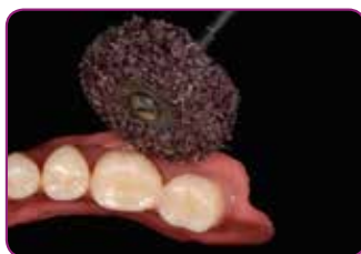
Viimeistele GC RELINE II -viimeistelylaikalla.