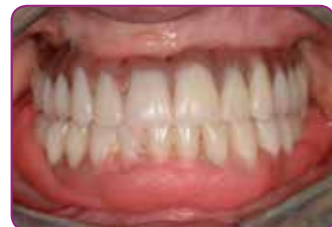
Sovita proteesi suuhun ja suorita lihastrimmaus. Pidä paikoillaan tasan viiden minuutin ajan.