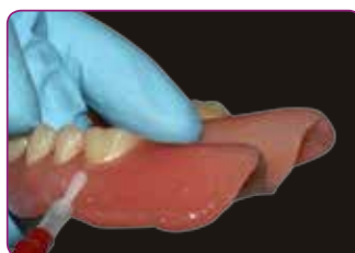
Reunojen suojaaminen Reline II finishing material -tuotteella.