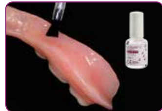
Levitä GC RELINE II PRIMER reunustettavalle alueelle. Kuivaa varovasti ilmalla.