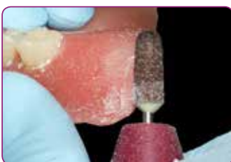
Parempi trimmattavuus, paremmin viimeistellyt reunat.

Materiaalia voi lisätä kolme kuukautta ensimmäisestä levityksestä ja näin mukautua limakalvolla ja luustossa tapahtuneisiin muutoksiin. Uuden Reline II remover for resin -irrotusaineen avulla pohjaus on helppo poistaa ja korvata nopeasti.