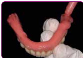
Levitä GC RELINE II (Extra) Soft. Työskentelyaika on tasan kaksi minuuttia.