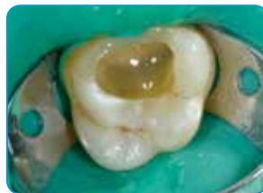
everX Flow -materiaalin applikointi (Väri: Bulk)