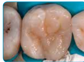
Viimeinen kerros Essentia-materiaalilla (Väri: Universal)