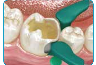
Jos kyseessä on luokan II kaviteetti, rakenna puuttuvat seinämät tavallisella yhdistelmämuovilla