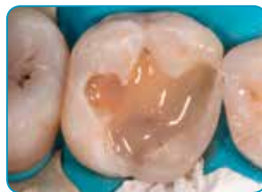
everX Flow -materiaalin applikointi (Väri: Dentin)