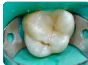
Viimeinen kerros G-aenial Universal Injectable -materiaalilla (Väri: A3)