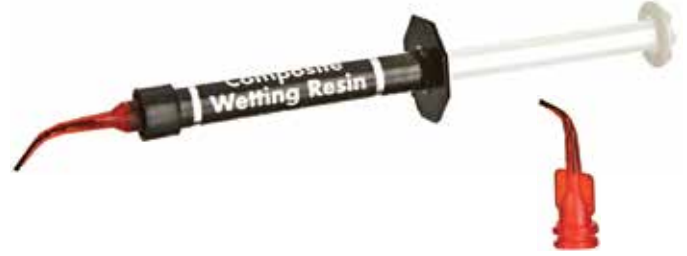
Inspiral™ Brush -kärki