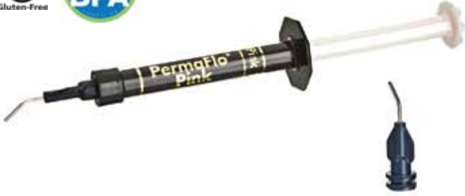
Micro 20 G Tip -kärki