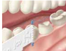
4. Tee mittaus huolellisesti, sillä kerran sinetöidystä pakkauksesta otettua kruunua ei voi säästää myöhemmin käytettäväksi.