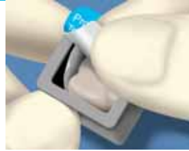
2. Poista kruunu sinetöidystä valotiviistä pakkauksesta.