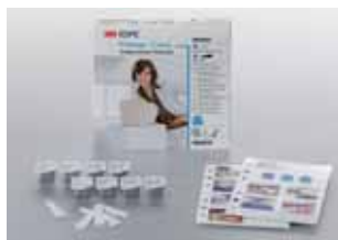
Protemp™ väliaikaskruunu, Kokeilupakkaus