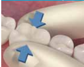
6. Sovita kruunu paikoilleen. Muotoile ja tarkista approksimaaliviilit ja preparoidut reunat siten, että kruunu istuu tiiviisti kostutetulla preparoinnilla.