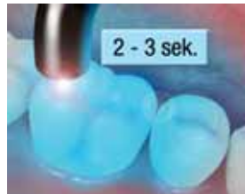
12. Pikakoveta purupintaa 2 - 3 sekuntia.