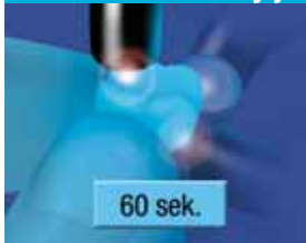
14. Valokoveta muotoiltu kruunu suun ulkopuolella yhteensä 60 sekuntia.