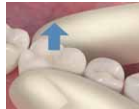
13. Irrota kruunu varovasti.