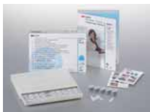
Protemp™ väliaikaskruunu, Aloituspakkaus