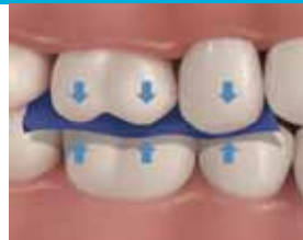
16. Tarkista purenta.

6. Sovita kruunua useaan kertaan ennen lopullista 60 sekunnin valokovetusta.