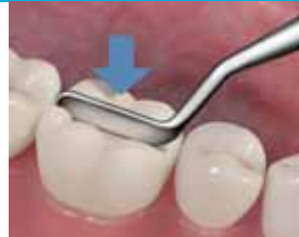
8. Tarkista vielä purenta.