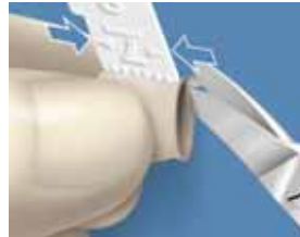
5. Poistettava ylimäärä määritellään mittaamalla viereisten hampaiden keskimääräinen korkeus. Ienrajan ylimäärät ja kruunun oikea pituus leikataan kruunusaksilla.