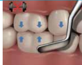
7. Tarkista purenta kevyessä kontaktissa. Muotoile bukkaalireuna.