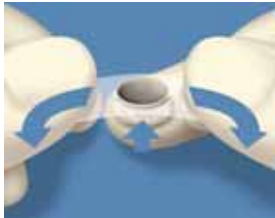
3. Venytä suojakelmaa peukaloiden ja etusormien välissä ja paina kruunu irti suojakelmusta.