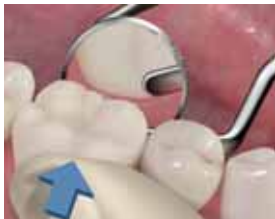
10. Sovita linguaalireuna. Linguaalireunaa muotoilitaessa paina sormella kevyesti bukkaalipuolelta, jottei kruunu siirry paikaltaan.