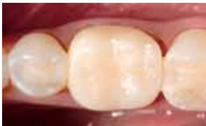
Valmis Protemp väliaikaiskruunu

3M™ ESPE™:llä on ensimmäinen yksittäinen, hampaanvärinen, yksilöllisesti muotoiltava ja valokovetteinen väliaikaiskruunu. Uusi tekniikka säästää aikaa ja tehostaa merkittävästi työskentelyä.