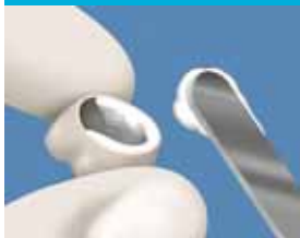
17. Eristä hammas kosteudelta. Valmista väliaikaisementti ja levitä kruunun sisäpinnalle.