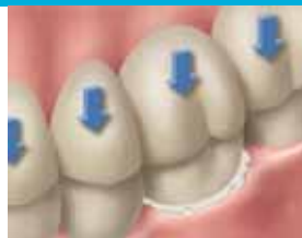
18. Aseta kruunu hitaasti paikalleen painamalla sitä kevyesti peukalolla. Anna ylimääräisen sementin puristua ulos kevyessä purennassa.