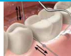
19. Poista sementtilylimäärät. Käytä hammaslankaa approksimaalialueilla. Tarkista sulkus.