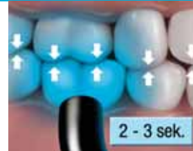
9. Pikakoveta bukkaalisesti 2 - 3 sekuntia. Varo ylikovettamista.