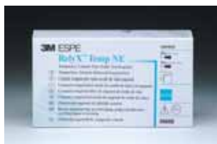
RelyX™ Temp NE väliaikassementti 56660