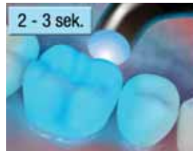
11. Pikakoveta linguaalipuolta 2 - 3 sekuntia.